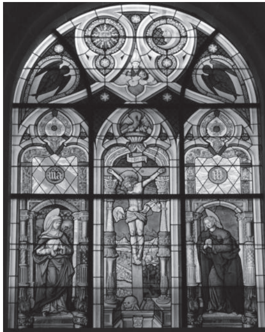
Fenster im Berner Münster

Eröffnet wird die Ausstellung am 1. Mai um 15:00 Uhr mit dem Frühjahrskonzert der Musik- und Kunstschule Jena.