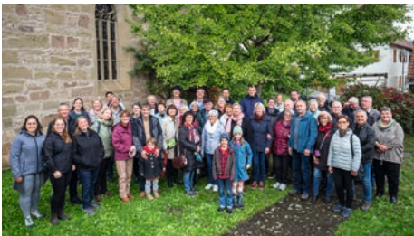
Gruppenfoto 2022 vor der Konradskirche und dem gemeinsam gepflanzten „Partnerschafts-Ginkgo-Baum“

Letztes Jahr haben wir 60 Jahre Partnerschaft zwischen der Kirchengemeinde Geradstetten und den Orten der Kirchengemeinde Milda gefeiert. Eine Gruppe aus unserer Gemeinde war zu Besuch im schönen Remstal und hat ein freudiges und bestärkendes Wochenende verbracht.