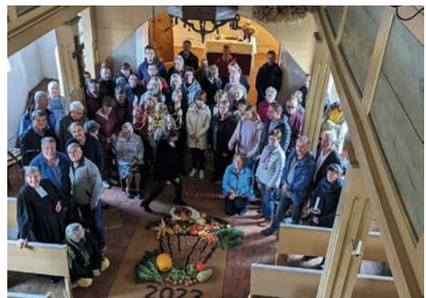
Besuch aus der Partnergemeinde Geradstetten am 08. Oktober

In anderen Orten organisieren ebenso Frauen das Erstellen und Verteilen von Geburtstagskarten, z. B. in Bucha und Magdala. Vielleicht finden sich auch in Milda Menschen, die dieses Ehrenamt weiterführen, vielleicht auch mit den umliegenden Orten zusammen.