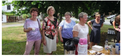
1. Station Kirche Oßmaritz