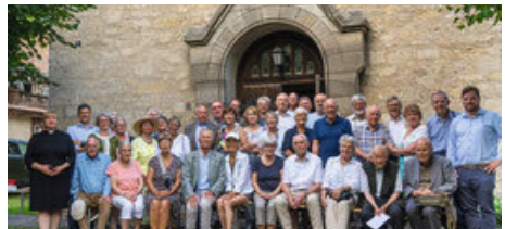
Mitglieder KBV Jena zur Kirchenfahrt in Bucha