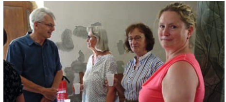
2. Station Kirche Schorba