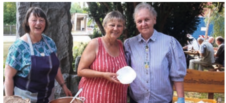
3. Station Kirche Bucha