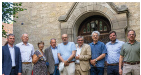
Der neu gewählte Vorstand im KBV Jena