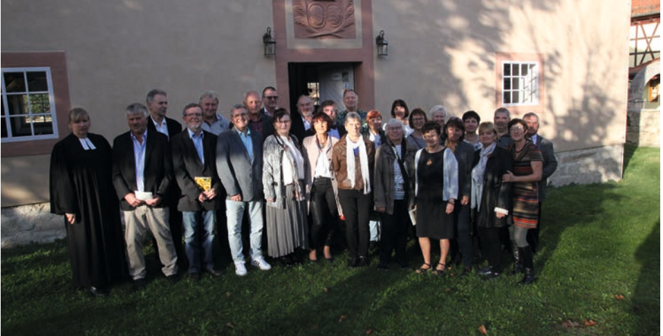
Goldene Konfirmation der Jahrgänge 1970, 1971 und 1972 auf dem Gebirge.