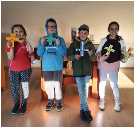
Die Kinder in Bucha präsentieren ihr eigenes Kreuz.

In Großkröbitz haben die Kinder aus der Kinderkirche den Ostergottesdienst gestaltet. Gemeinsam haben wir mit dem Erzähltheater „Kamishibai“ die Ostergeschichte in Bildern erzählt.