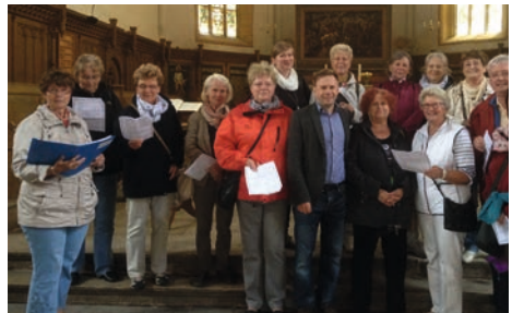
Kirche in Bad Langensalza