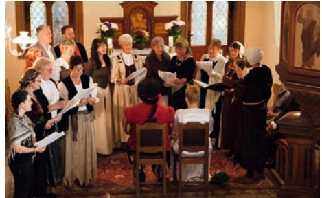
kirchliche Trauung Kirche Bucha, Motto Kleidung: Mittelalter