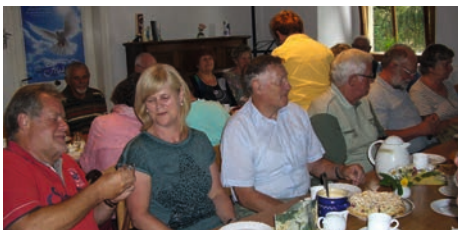
Treffen mit dem Posaunenchor der Partnergemeinde Waldbach in Magdala