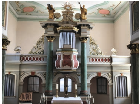
Innenansicht der Schorbaer Kirche

Am 26. Juni wird der Jenaer Kirchbauverein in unserem Kirchengemeindeverband unterwegs sein. Ca. 14 Uhr werden die Teilnehmer der Kirchenfahrt in Oßmaritz ankommen und die dortige Kirche St. Hubertus mit der frisch sanierten Peternell-Orgel besichtigen. Im Anschluss geht es weiter nach Schorba.