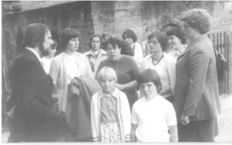
Chorfahrt 12.9.1976 Klosterkirche Thalbürgel