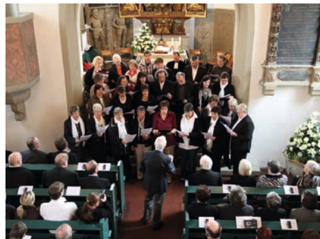
Zu Besuch bei der Partnergemeinde Kleinbottwar

Wir möchten uns bedanken, dass wir in den vielen Jahrzehnten als Kirchenchor gern mit Freude, Spaß, voller Energie und Engagement für unsere Kirchengemeinde wirken durften. Nicht selten sind wir mit der Konfirmation in den Kirchenchor eingetreten.