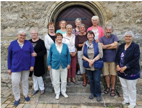
Unser Chor vor der Kirche St. Johannis in Magdala (Irgendwer fehlt immer)