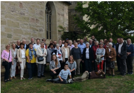
Gruppenfoto 2018 in Geradstetten

Nach zwei Jahren Corona-Zwangspause ist es nun wieder so weit. Am 01. und 02. Oktober wollen wir unsere Freunde aus Geradstetten im schönen Remstal besuchen. Wir starten am Samstag (01.10.) früh um ca. 6 Uhr mit einem Bus. Gegen Mittag werden wir in Baden-Württemberg ankommen und zu unseren Gastfamilien gehen. Dort gibt es eine leckere Stärkung und am Nachmittag werden wir bei einem gemeinsamen Ausflug die Schönheiten der Region kennenlernen. Abends wollen wir wie gewohnt im Gemeindehaus Kelter feiern. Am Sonntag stehen neben dem gemeinsamen Gottesdienst und Mittagessen noch weitere kleinere Programmpunkte auf dem Plan. Am späten Nachmittag werden wir die Heimreise antreten. Um Planungssicherheit für den Bus zu haben brauchen wir bis Ende Juli verbindliche Anmeldungen für die Fahrt. Melden Sie sich gern bei Ihren Kirchenältesten vor Ort. Mit diesem Besuch in Geradstetten wollen wir das 60-jährige Jubiläum unserer Partnerschaft und das 30-jährige Jubiläum unserer gegenseitigen Besuche (nach)-feiern.