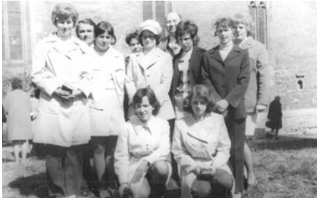
April 1974 vor der Kirche St. Joh. Magdala